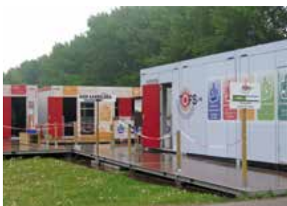
Paviljoen Time Out For Safety Days BASF

In het voorjaar van 2014 werd door BASF op de site in Antwerpen de Time Out For Safety Days gehouden. Deze veiligheidsexpositie is bestemd voor de medewerkers van BASF en de contractors op de site. Zo'n 1.000 bezoekers hebben de TOFS Days bezocht. Door BRAND werd het nieuwe stellingslot als best practice gepresenteerd. "Makkelijk én effectief" is een van de veel gehoorde positieve reacties op deze veiligheidsinnovatie!